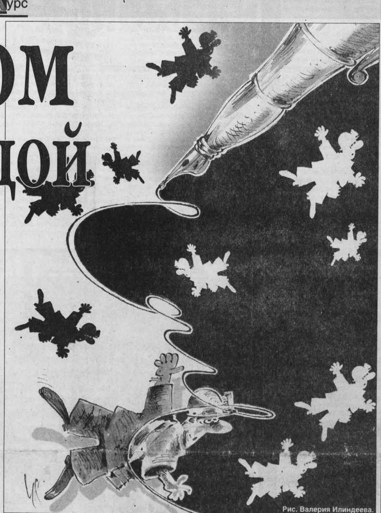
Рис. Валерия Илиндева.

женерно-технического надзора с 1992 года (!) Почему за точку отсчета взято именно этот год, остается тайной за семью печатями. Правда, после долгих размышлений напрашивается вывод, что все ИТР, которые работали до этого времени, дневали и ночевали в шахте и поэтому в каком бы то ни было подтверждении не нуждаются. Кроме того, хорошо, если предприятие действующее. Тогда, подняв архив, можно хотя бы оформить документы задним числом. А если шахты приказали долго жить и архив не весь сохранился? Поверить на слово бедолаге, тчотно пытающемуся восстановить старые графики выходов? Или все-таки придется сматерить филкингу грамоту? Проккопьевск.