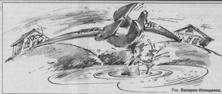
Рис. Валерия Илиндрова.

То, что реорганизация структуры жилищно-коммунального хозяйства в Яе неизбежна, давно было очевидно. Как-то на одном из районных совещаний заместитель губернатора области Александр Николаевич Наумов сравнил систему Яйского ЖКХ с давно вымершими динозаврами.