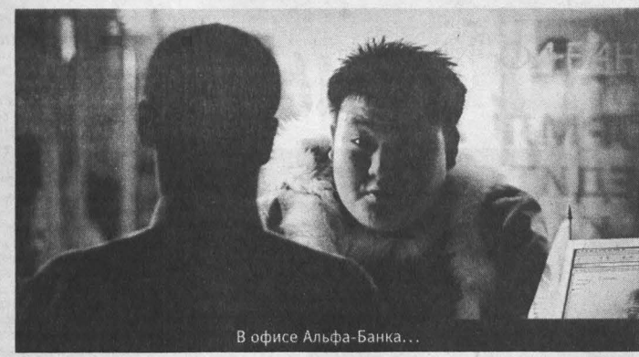
В офисе Альфа-Банка...