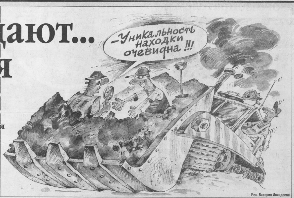
Рис. Валерия Илландова.

Должны были начаться археологические раскопки на Советской площади, неподалеку от исторического памятника города — здания Кузнецкого казначейства. Однако, как и предыдущие археологические работы, они в очередной раз сорвались, а дата раскопок перенесена на неопределенный срок.