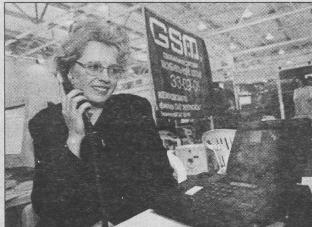
Видеотелефонная связь, представленная на выставке «Экспо-Связь», 2001 г.

ры хозяйственной жизни и тем самым повышает имидж и инвестиционную привлекательность Кузбасса. «Электросвязь» Кемеровской области увеличивает темпы роста объёмов современных телекоммуникационных услуг: глобальной информационной сети Интернет, электронной почты, сотовой и пейджинговой связи.