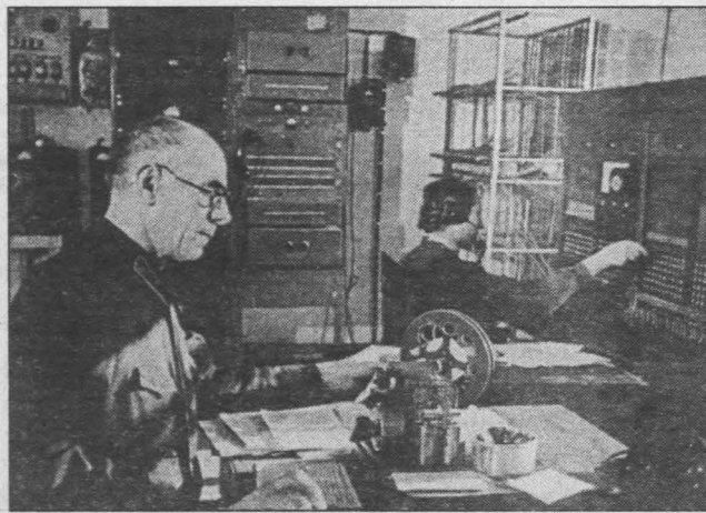
Совмещенные средства связи Тяжинской конторы связи, 1957 г.

В настоящее время «Электросвязь» Кемеровской области — одно из ведущих предприятий телефонной связи России. Являясь одной из важных опор экономики Кузбасса, компания обеспечивает качественной связью население и все сфе-