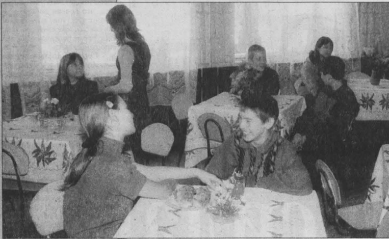
Кафе «Клеопатра» — первое «собственное дело», открытое в школе №7 Анжеро-Судженска.