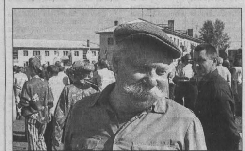
На празднике.

В трех шагах от Дома культуры развернулась ярмарка. Каждая улица выставила свою продукцию. Хозяйки предлагали посетителям отведать домашних булочек, блинов, пирожных, тортов... Затем чествовали и награждали жителей села — старожилы, участники ВОВ, локальных войн, труженики тыла, вдов, представители трудовых династий, передовиков производства, юбиляров и новорожденных.