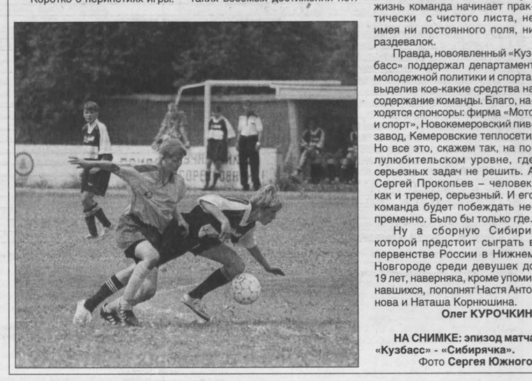
НА СНИМКЕ: эпизод матча «Кузбасс» — «Сибирячка».