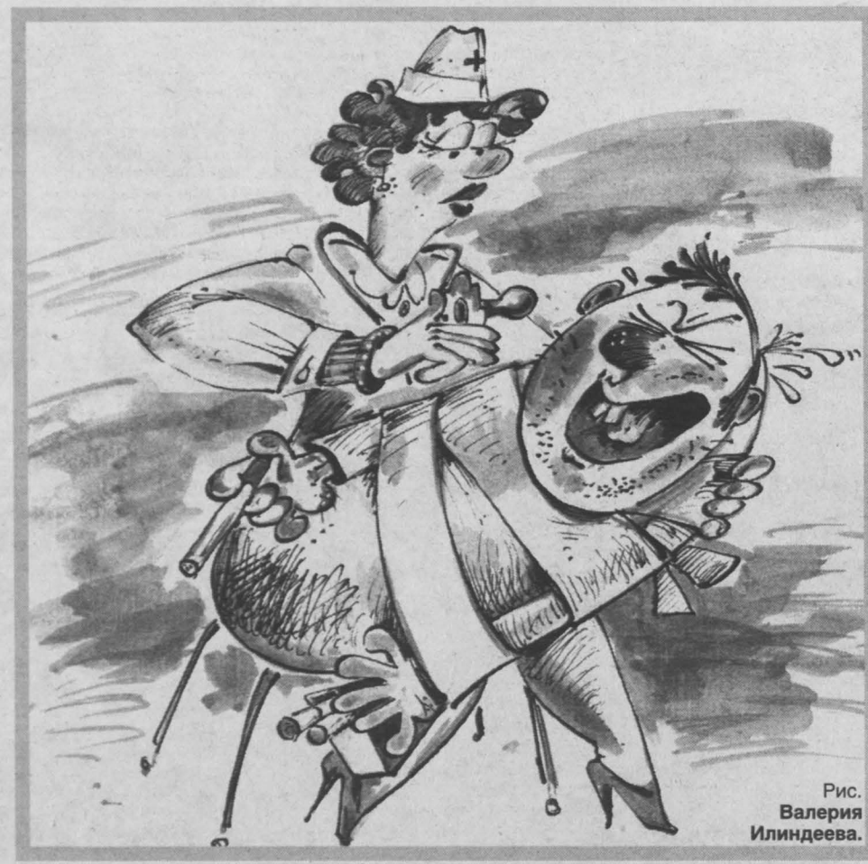
Рис. Валерия Илиндева.

— Чаще всего, когда у них возникают какие-то серьезные проблемы со здоровьем — начинают страдать легкие, печень, желудок, сосуды. Реже — когда они попадают в новую компанию или переходят на новую работу, где все — некурящие, и начинают чувствовать себя «белой вороной». Ну, и еще одна причина, когда они осознают, что сигарета лишает их других радостей жизни, отнимает время, которого и так ни на что не хватает. Один пациент нашего центра рассказывал,