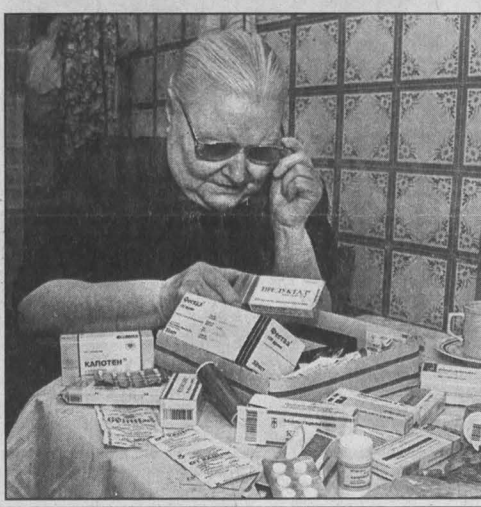
В середине декабря прошлого года «Кузбассфарма» участвовала в выставке-продаже медикаментов в ДК Всероссийского общества слепых и оказала гуманитарную помощь ветеранам.

Жизнь в Кузбассе стабилизировалась, это факт. Вовремя выплачиваются зарплаты и пенсии, детские пособия. Администрация области делает многое для социальной поддержки малоимущего населения.