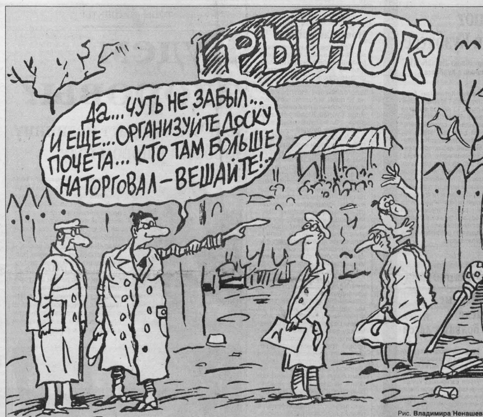
Рис. Владимира Ненашева.

— Вы говорили, что готовы помогать предпринимателям.