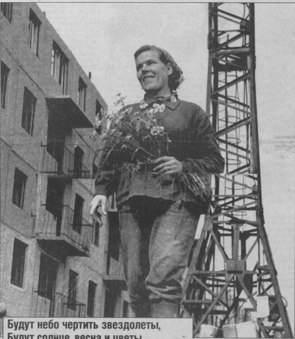
Будут небо чертить звездолеты, Будут солнце, весна и цветы. Возвеличится слово Работа До высокой своей красоты. Валентин МАХАЛОВ. НА СНИМКЕ: так строился Тырган — новый район Прокопьевска.