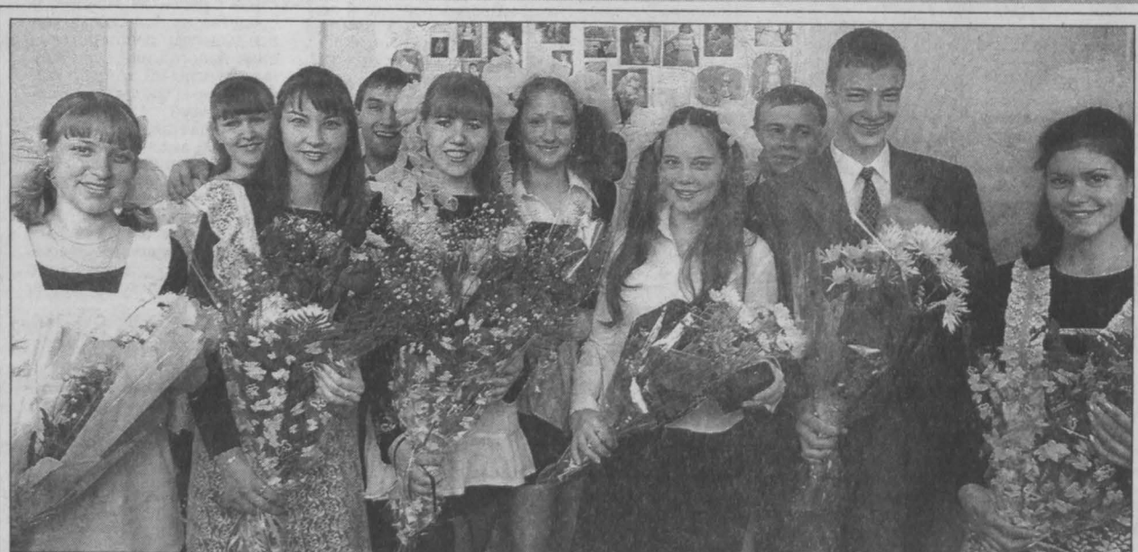
Выпускники гимназии №41.