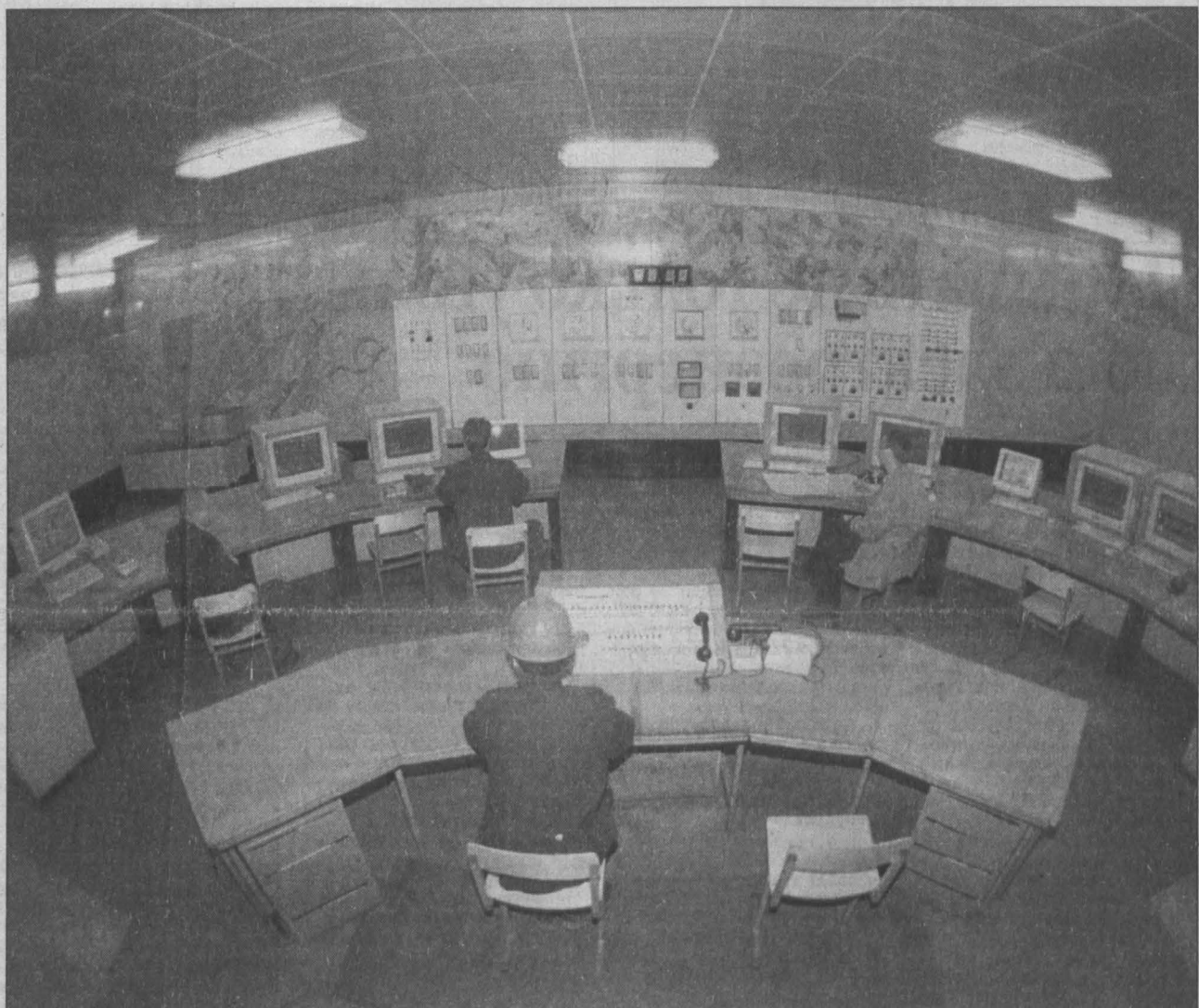
Пульс управления доменной печью № 3 Записки.

То, чем губернатор Кузбасса Аман Тулеев с тревогой предупреждал президента Владимира Путина во время их недавней встречи, стало реальностью. Отсутствие четкой государственной промышленной политики, чрезмерная зависимость экономики от поведения монополий привели к кризисным явлениям уже не только в угольной, но и в другой базовой отрасли российской экономики — металлургии. Металлургическая промышленность — одна из специализаций России в условиях международного разделения труда. В 2001 году она давала 7 проц. мирового производства и торговли металлами (4-е место в мире), прокат черных металлов составил 10 проц. мирового (1-е место). Доля России в мировом производстве шести основных видов цветных металлов (алюминия, никеля, меди, цинка, свинца, олова) — около 8,5 проц. Отрасль создает 8 проц. ВВП, 16,5 проц. всей промышленной продукции, производимой в стране. На 30 проц. обеспечивает грузовой перевозкой, дает 14,4 проц. валютных поступлений и 7,8 проц. всех налоговых отчислений. Металлургия потребляет 25 проц. всего добываемого в стране угля и 33 проц. электроэнергии. В отрасли на 3,5 тыс. предприятий (75 процентов из них — градообразующие) работают полтора миллиона россиян. Кризис в ней способен нанести сокрушительный удар по всей экономике России.