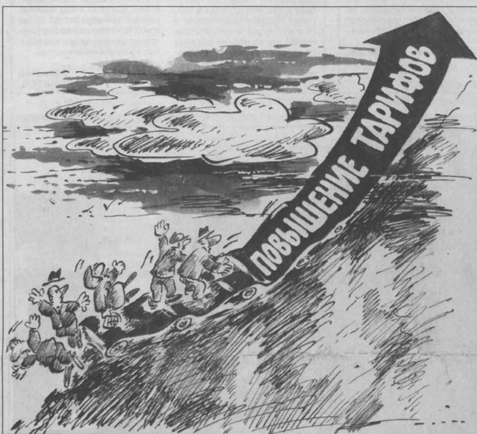
Рис. Валерия Илиндева.

С первого мая население станет выкладывать за одну потребленную гигакалорию 220 рублей — сразу на 44 рубля больше прежнего. А «прочие» потребители будут платить за нее и вовсе 461 рубль вместо 306. У всех автоматически возрастет плата за отопление, у обитателей коммунального жилья — квартплата. Уже подсчитано, что в среднем она поднимется на 30 процентов.