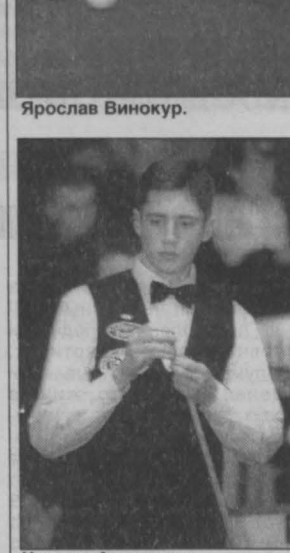
Во время соревнований.