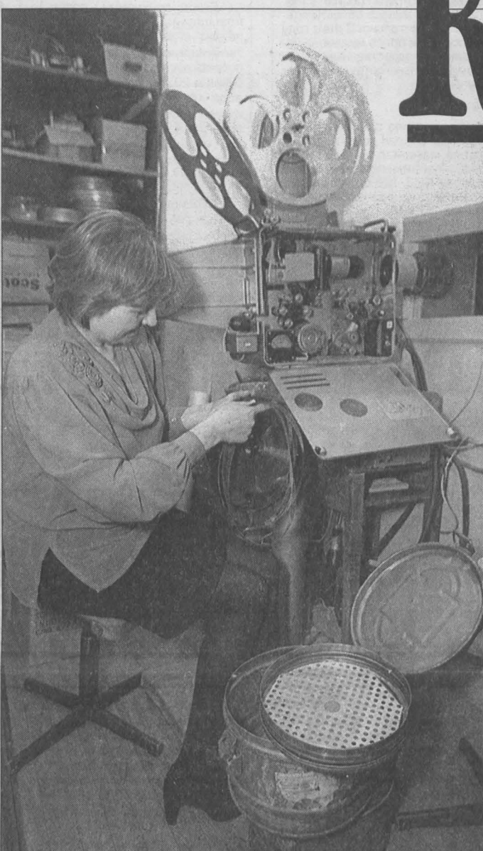
В аппаратной государственного учреждения культуры «Областной киновидеотеатр». Практически каждый фильм, который отправляется на киноустановки области, прежде просматривают здесь.

Давно ли мы все ратовали за возрождение кинообслуживания сельских жителей? Действительно, положение складывалось, мягко говоря, печальное. Все из-за тех же финансовых проблем селяне лишились возможности посмотреть фильмы.