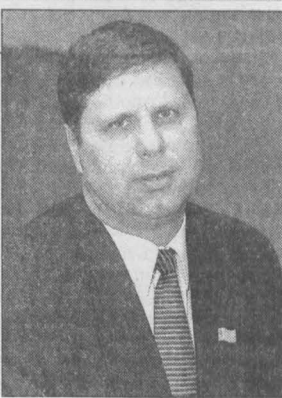
Распрашивала Татьяна КРАСНОСЕЛЬСКАЯ.