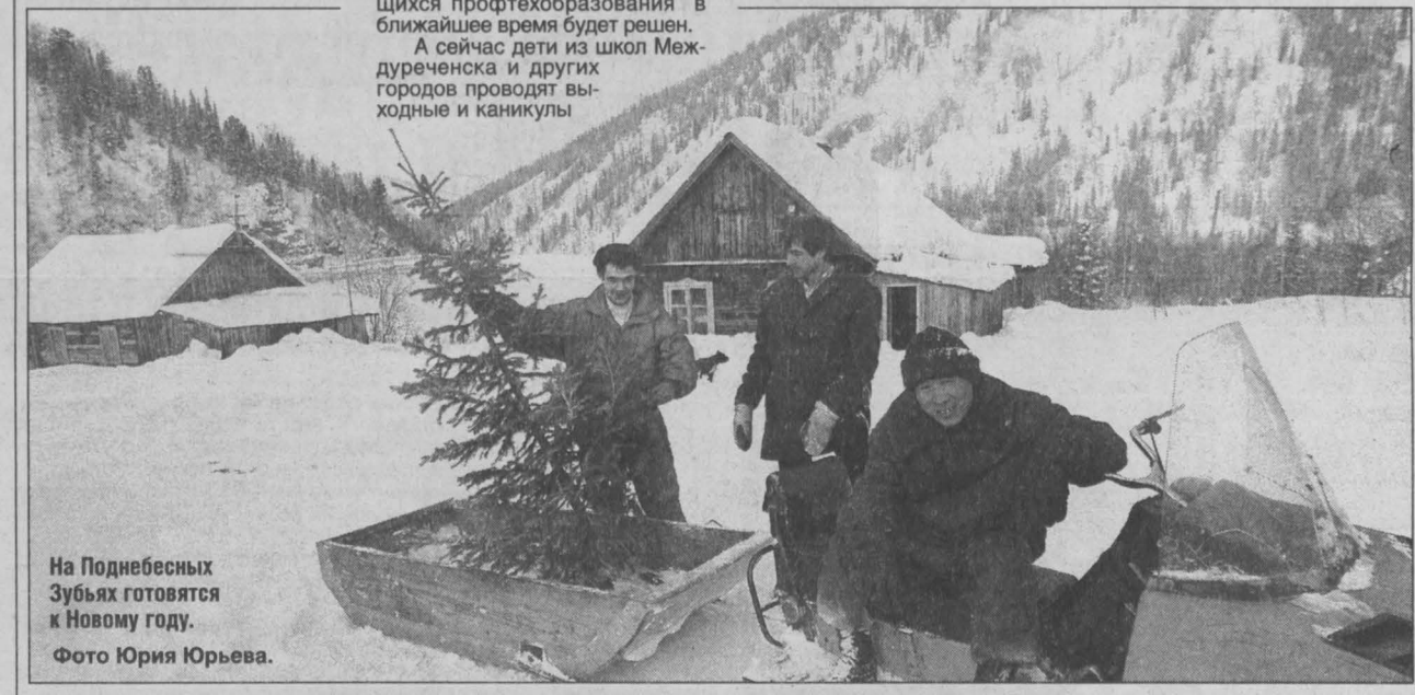
На Поднебесных Зубьях готовятся к Новому году.