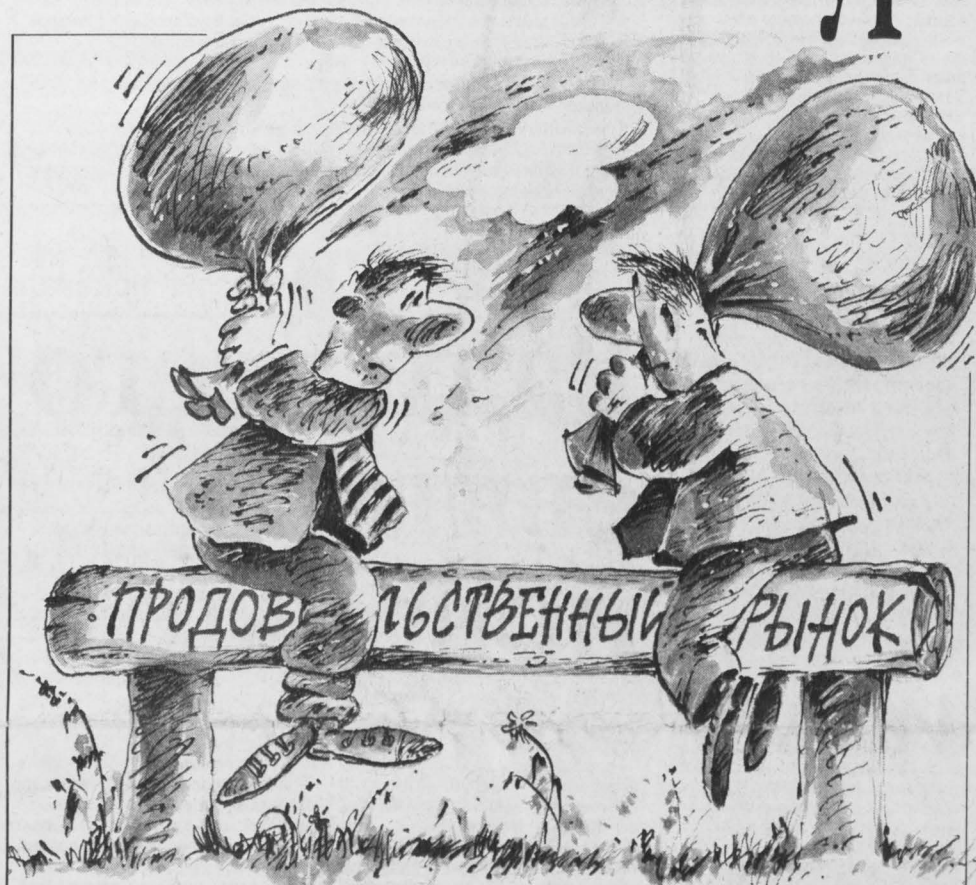
Рис. Валерия Илинцева.

Да, сегодня мы не можем полностью обеспечить рынок всеми видами продукции. Но у нас есть возможности в достатке снабжать учебные заведения, больницы, детские сады молочными изделиями, яйцами, овощами, мясными продуктами собственного производства. И, как подчеркивалось на совещании, по ценам более низким, чем заводские. Кроме того, у нас существует система взаимозачетов, наши хозяйства могут поставлять продукцию и в кредит, с расрочкой платежей. Вот студенты вузов жалуются на дорогие обеды. Департамент торговли выяснил, что снабженцы каждого вуза обеспечивают свои столовые продуктами разных поставщиков, особо не обременяясь поиском более дешевых источников, хотя они есть. Например, система потребкооперации. Отправили в вузы программы, расценки, но заинтересованного ответа не получили.