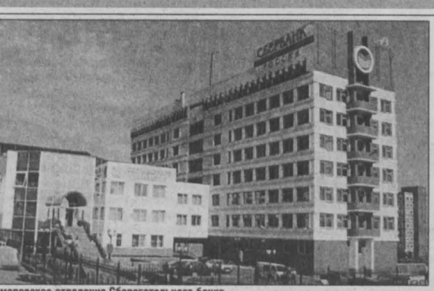
Кемеровское отделение Сбербанка России

на 01.10.02г. учреждениями Сбербанка России эмитировано почти 130 тыс. банковских карт, в т. ч. 2,3 тыс. шт. карт крупнейших международных платежных систем. Владельцев карт обслуживают 121 учреждение банка, 56 банкоматов, 319 торговых-сервисных предприятий. В последнее время на рынке появились такие новые, специализированные для групп населения, карточные продукты, как Maestro — «Студенческая», Maestro — «Пенсионная», облегчающие процесс получения стипендии и пенсионных выплат, дающих право на скидки в торговых-сервисных предприятиях на территории России и за рубежом, а также Visa Aeroфлот с льготами для пассажиров Aeroфлота. Много внимания уделяет банк и улучшению качества обслуживания населения. Например, в октябре в пяти дополнительных офисах Кемеровского ОПС установлены электронные кассирши (кэш-диспенсеры), обслуживающие клиента не более одной-двух минут. Большое внимание в работе банка уделяется обслуживанию юридических лиц (предприятий, организаций), частных предпринимателей. На сегодняшний день открыты в учреждениях банка, работающих в области, более 25 тысяч расчетных, текущих, бюджетных счетов. Совокупный остаток средств достиг 1,7 млрд. руб. и 3,8 млн. дол. США. Доля средств корпоратив-