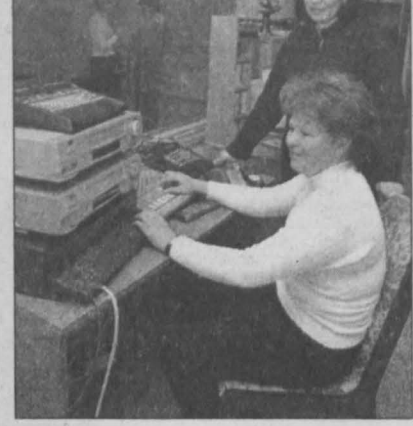
В редакции Таштагольского телевидения кипит работа.

росы телезрителей, встречи с интересными людьми. Недавно, например, Таштагольское телевидение производило надвиги над шахтными зданиями на ствол «Сибиряк». Значительное производственное событие: здание передавали аж на 65 метров! В связи с этим гостем студии стал инженер ОКБ этого предприятия. Интересно! Но, как говорится, лучше один раз увидеть... В 20.00 по вторникам, средам и пятницам. А главное, что мы охотились в редакции Таштагольского телевидения, — хороший творческий накал. Здесь не стоит на месте, ищут и находят. Новых вам ярких находок, юбиляров! Арина ПОЛУСТУЕВА, Таштагол.