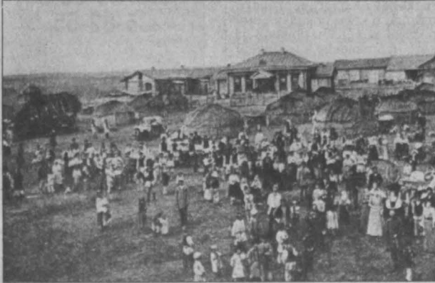
Переселенческий пункт близ станции Канск.