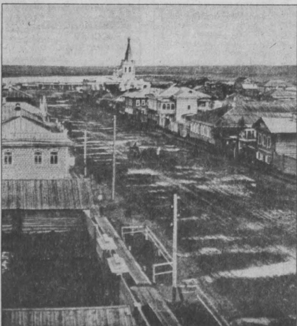
Маринский, Томская губерния.

(По материалам «Сибирского архива», выпуск 3).