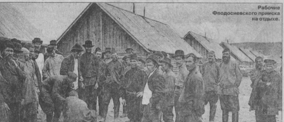
Рабочие Феодосиевского прииска на отдыхе.

✓ На золотых приисках в Маринском округе и в Южно-Енисейской тайге установленные первые три драги, к 1908 году на приисках Урала и Сибири уже работало 64 драги. ✓ В Западной Сибири действует 275 модельных заводов. ✓ В мае начались волнения рабочих Красноярских железнодорожных мастерских, а мавка углекислотой пятой шахты Судженских копей переросла в забастовку, которую поддержали горняки других шахт; администрация была вынуждена прибегнуть к сокращению рабочего дня, увеличению зарплат; требования были частично удовлетворены.