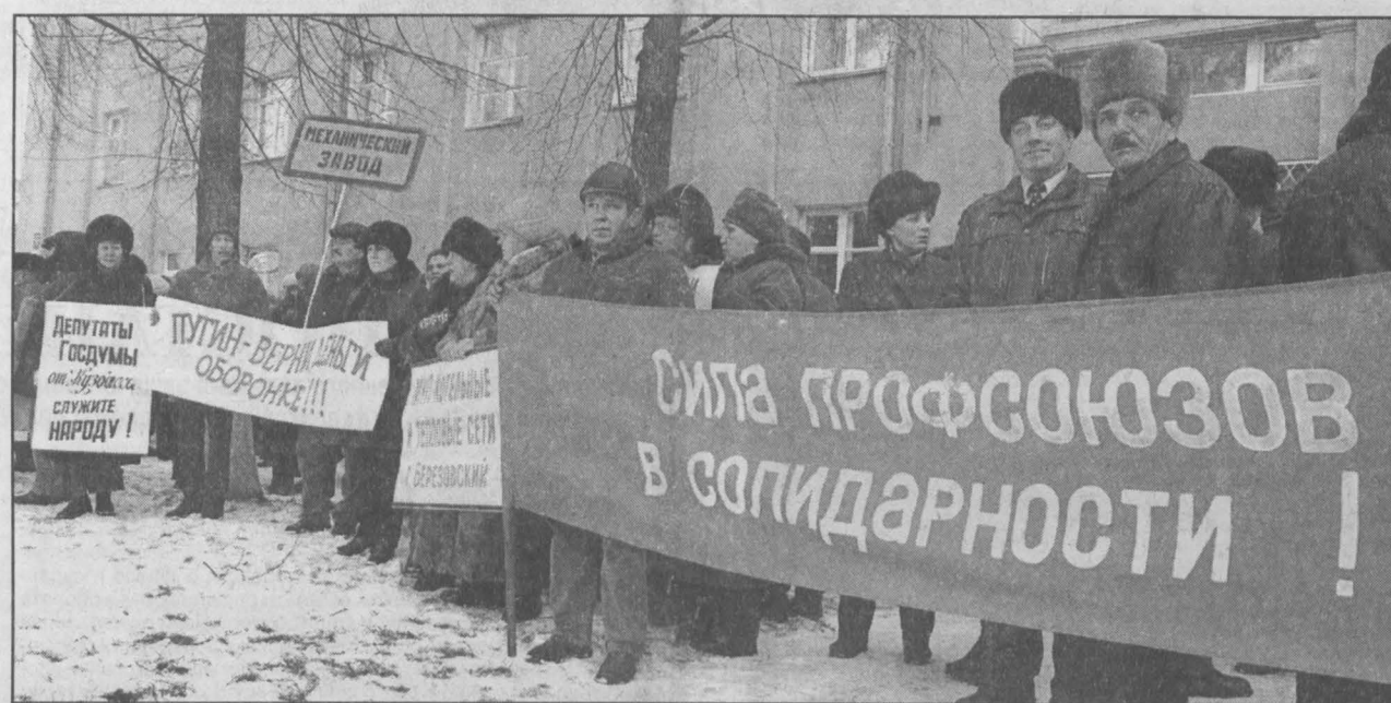
Кемерово. Пикет акции профсоюзов.