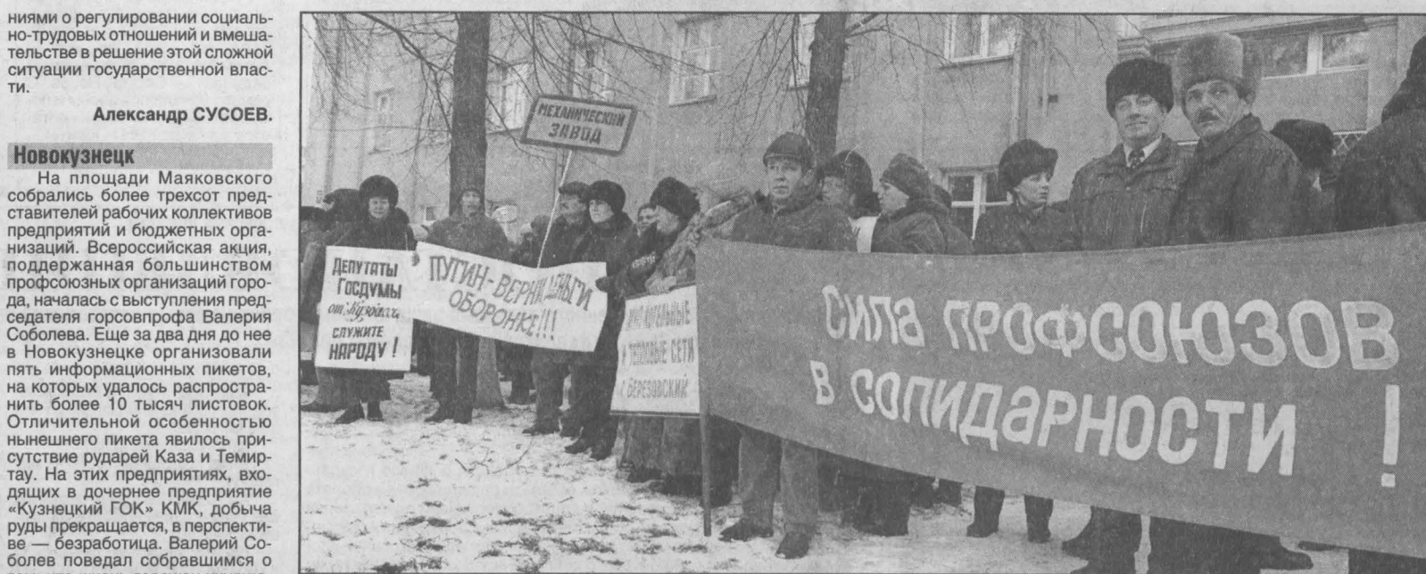
Кемерово. Пикет акции профсоюзов.