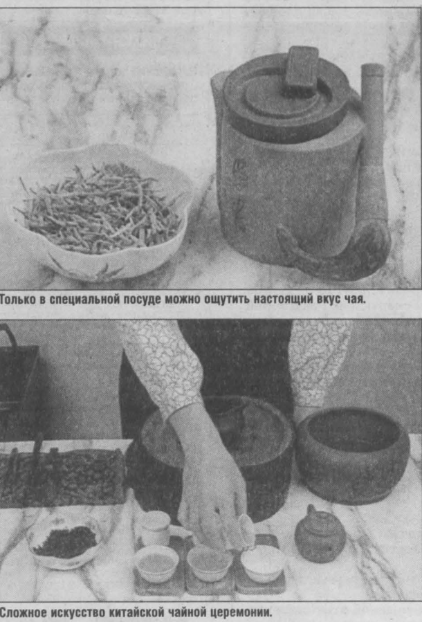
Сложное искусство китайской чайной церемонии.