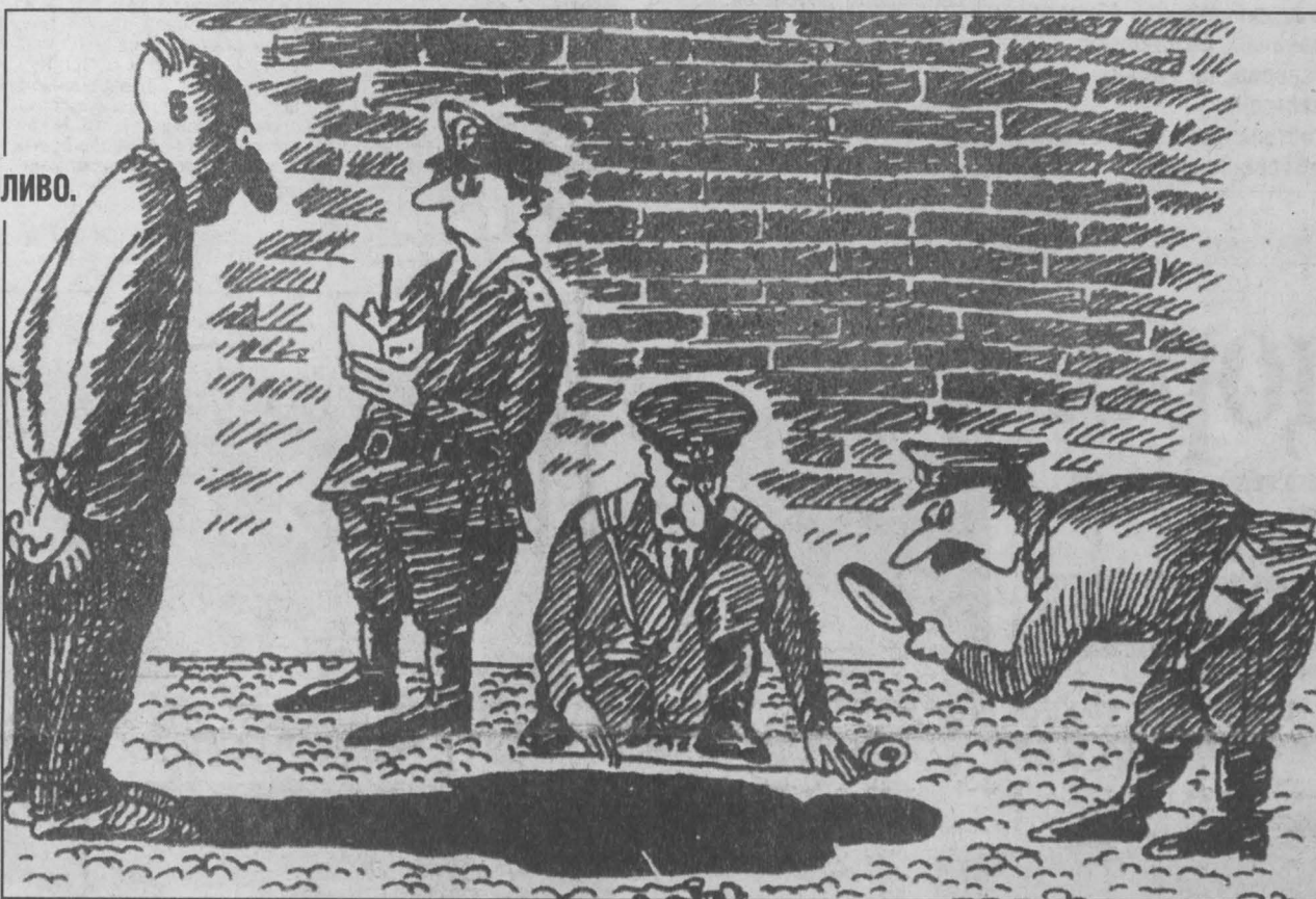
Рис. Александра Зудина.

«21.09. на контрольно-пропускном пункте при попытке провезти 400 литров солярки задержан автомобиль «КамАЗ». Дизтопливо изъято, водитель административно наказан...» «30.09. на территории разреза задержан автомобиль «ИЖ-комби» с водителем Н., изъято 300 литров солярки. Топливо сдано, водитель отпущен...» «21.08. на КПП задержаны две вахтовки с полными баками дизтоплива. Переданы руководству разреза...» «15.09. в боксе ДГТУ обнаружено и изъято 120 литров солярки...» «28.08. Задержана вахтовка, которая вывезла с территории разреза 980 литров солярки. Топливо изъято, материалы переданы руководству...»