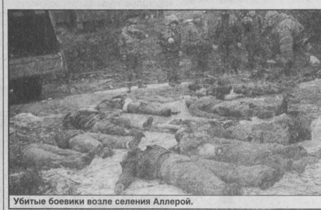
Убитые боевики возле селения Аллерой.

Во время очередной командировки на Северный Кавказ довелось побеседовать в Гудермесе с пленным боевиком, которого незадолго до этого в ходе удачной спецоперации захватили сотрудники ФСБ.