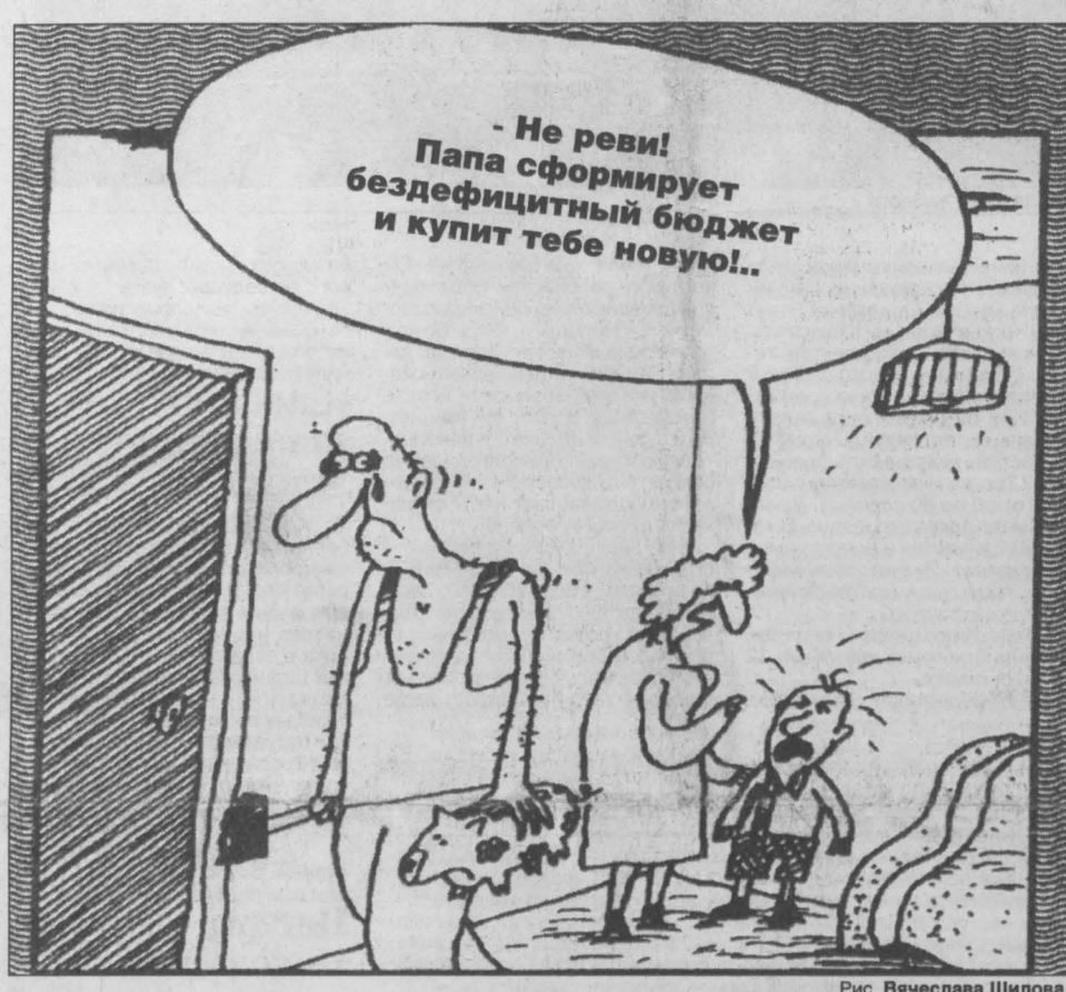
Рис. Вячеслава Шилова.

Недавно депутаты Государственной думы приняли проект бюджета будущего года в первом чтении. Еще накануне парламентарии заявляли, что ждать острых дискуссий при первом чтении не стоит.