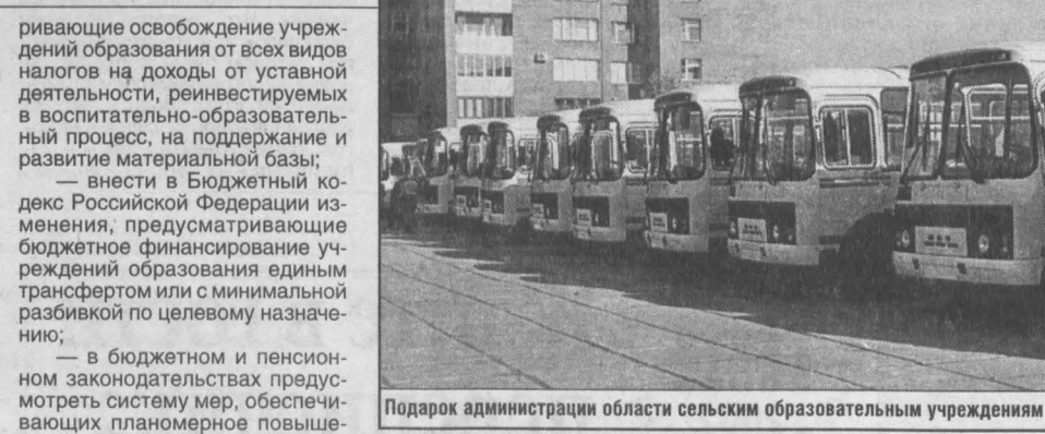
Подарок администрации области сельским образовательным учреждениям - 15 новых автобусов.

ривающие освобождение учреждений образования от всех видов налогов на доходы от уставной деятельности, реинвестируемых в воспитательно-образовательный процесс, на поддержание и развитие материальной базы; внести в Бюджетный кодекс Российской Федерации изменения, предусматривающие бюджетное финансирование учреждений образования единым трансфертом или с минимальной разбивкой по целевому назначению; — в бюджетном и пенсионном законодательствах предусмотреть систему мер, обеспечивающих планомерное повышение заработной платы, пенсионного обеспечения работников образования, установление надбавки за стаж педагогической работы и т. д. Мы обращаемся к вам, уважаемые коллеги, к каждому работнику системы образования области. Вы оставайтесь верными своей профессии, детям, закладывая фундамент будущих успехов нашей области, ее конкурентоспособности в стране. Учителя сегодня — это настоящие государственные деятели, просветители, чей вклад в строительство нового общества по достоинству пока еще не оценен. Мы призываем вас, коллеги, не поддаваться унынию, не быть безразличными к проблемам детей и общества. Выбрав одну из самых благородных профессий, вы знали, что будет нелегко, но ваш труд воплотится в судьбах ваших учеников и последователей. Будьте верны учительскому долгу. Мы обращаемся к вам, дорогие родители, доверившие нам самое дорогое, что у вас есть, — дети: не оставайтесь равнодушными к запросам школы, к про-