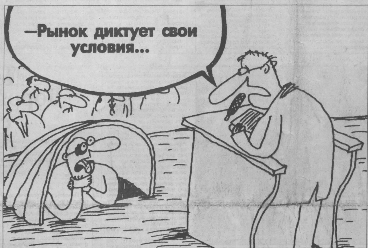
Рис. Вячеслава Шилова.

Некоторые проекты стали напоминать этих красных девок, засидевшихся в ожидании жениха, а их родители уже не чают, кому сплести это сокровище. Казалось, например, что водоугольное топливо вот-вот победит потечет по Кузбассу из котельной в котельную, сделав их современнее и чище, с их склада перестанут воровать уголь, а затраты на производство тепла снизятся настолько, что тарифы замерзнут. Трудно сказать, почему так и не воплотилась эта идея в какой-нибудь маленькой котельной, чтобы стать образцом для всех. Но по-прежнему мерзнут жилища,