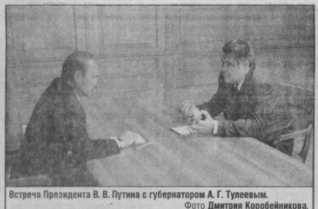
Встреча Президента В. В. Путина с губернатором А. Г. Тулеевым.

Президент РФ уточнил у губернатора список участников Рабочей группы по подготовке заседания Президиума Государственного Совета РФ по проблемам угольной промышленности, которое состоится на следующий день в Междуреченске. Аман Тулеев пояснил, что подготовка к этому мероприятию заняла три месяца и в ней участвовали руководители угольных объединений, Сибирского отделения Российской академии наук, а также многих министерств и профсоюзов.