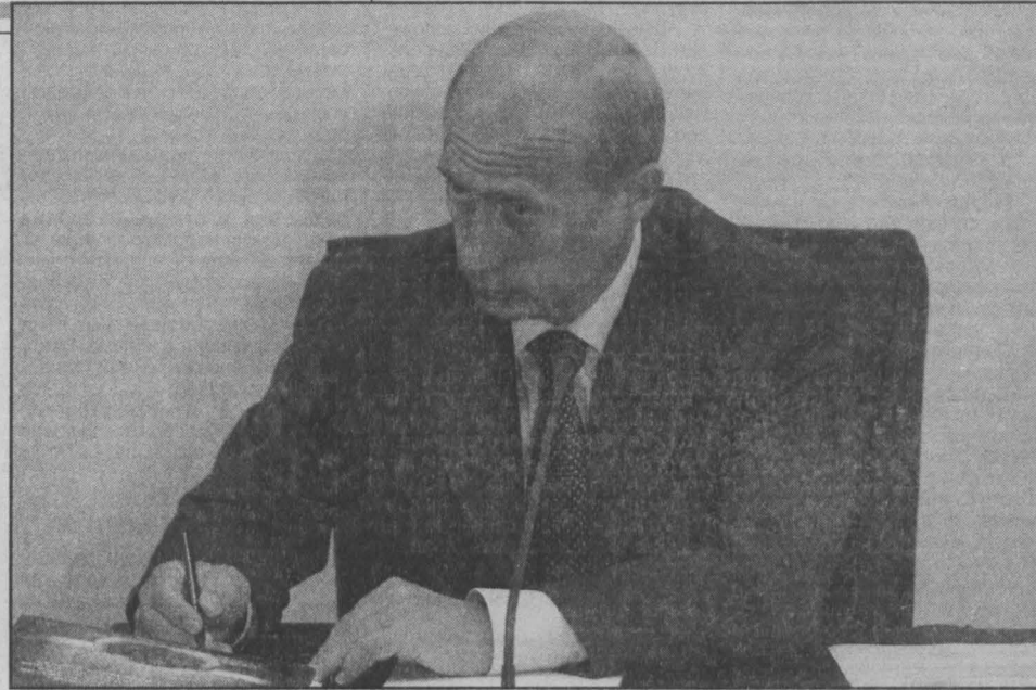
В. В. Путин во время заседания Президиума Госсовета.

Вчера в Междуреченске прошло заседание Президиума Госсовета по проблемам развития угольной промышленности. Его провел Президент Российской Федерации В. В. Путин. С докладом выступил губернатор Кемеровской области А. Г. Тулеев.