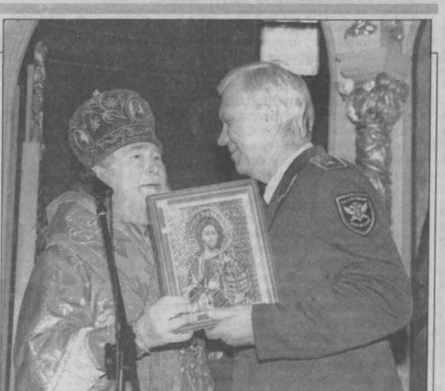
НА СНИМКЕ: эта икона отныне займет подобающее место в здании управления налоговой полиции.