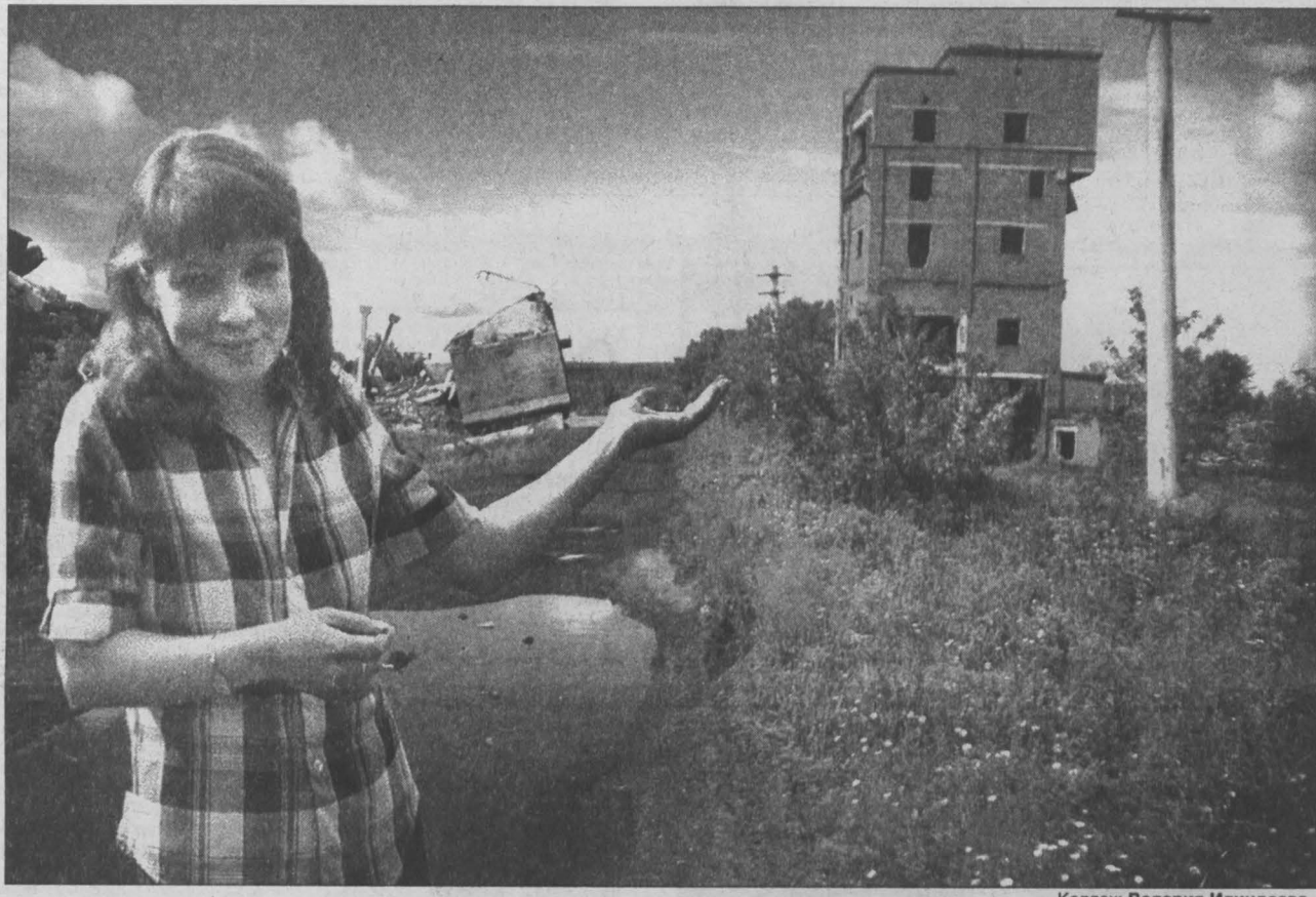
Коллаж Валерия Илиндева.