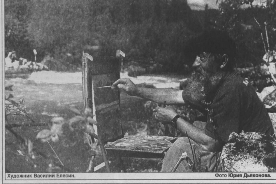
Художник Василий Елесин.