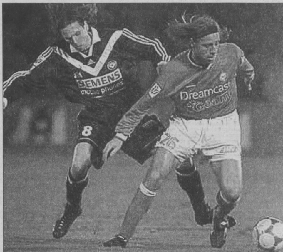
Смертин, 8-й номер французского «Бордо», прессингует нападающего.