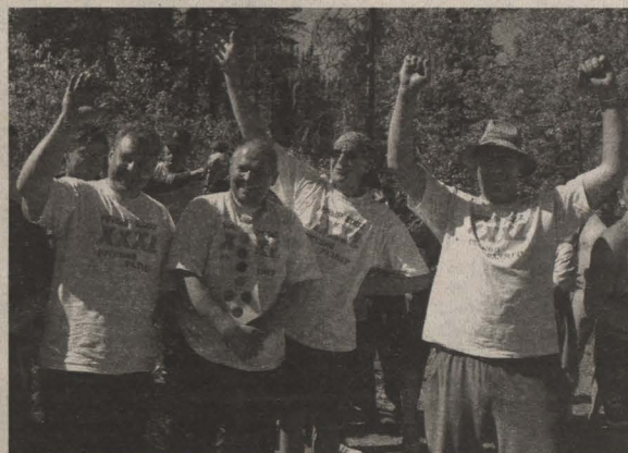
Ребята «Русского размера».

Да, хотелось бы уточнить, в заявке на участие в соревнованиях такой команды обнаружить не удалось.