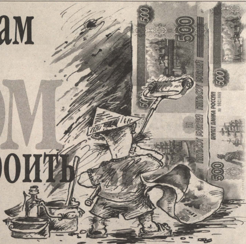
Рис. Валерия Илиндеева.

В Яе эта затея потянет, пожалуй, на 300-400 тысяч целковых