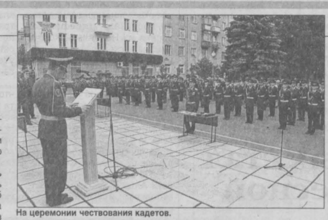
На церемонии чествования кадетов.

Уверенный строевой шаг, гордая осанка, смелый взгляд — вот они, будущие офицеры. А ныне выпускники Кемеровского кадетского корпуса радиозлектроники. Их предстоит выпустить в июне в парадной форме дружно маршировавшим, выстроившимся в ровные колонны. Громкоговорителем прокатилось по площадке: Нет, это уже не те юнцы, которые однажды робко переступили порог корпуса. Перед губернатором, командирами, учителями, счастливыми родителями — возмужавшие, окрепшие в тренировках кадеты. Немало наук пришлось им преодолеть за два года учебы. Кроме военной и физической подготовки, ребята знакомы с мировой художественной культурой, историей страны и Кемеровской области. Многим полюбился предмет история Российской армии. А что за кадет без знания хороших манер, фехтования и танцев? Наверное, поэтому наши кадеты принимают участие в разных конкурсах и занимают призовые места. Им предстоит особая честь — пройти торжественный марш на парад, посвященном Дню Победы.