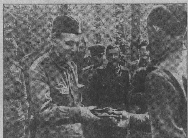
1943 год. Илья Эренбург вручает именное оружие.