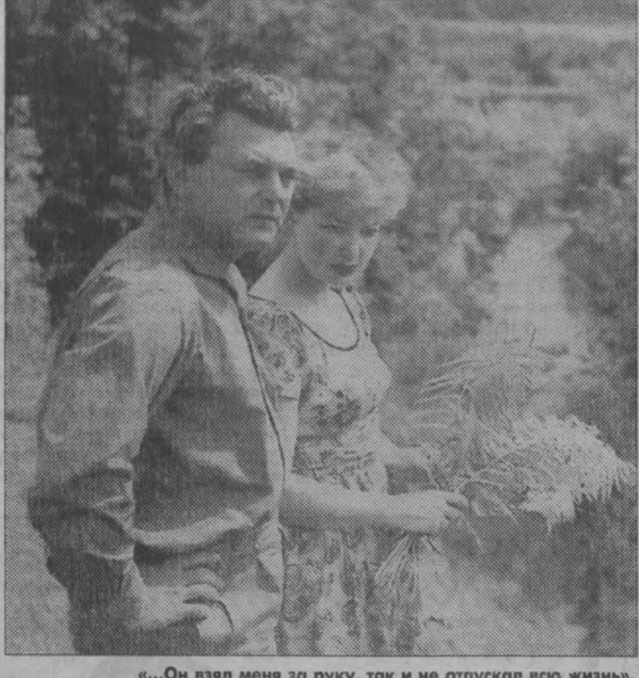
«...Он взял меня за руку, так и не отпустил всю жизнь»