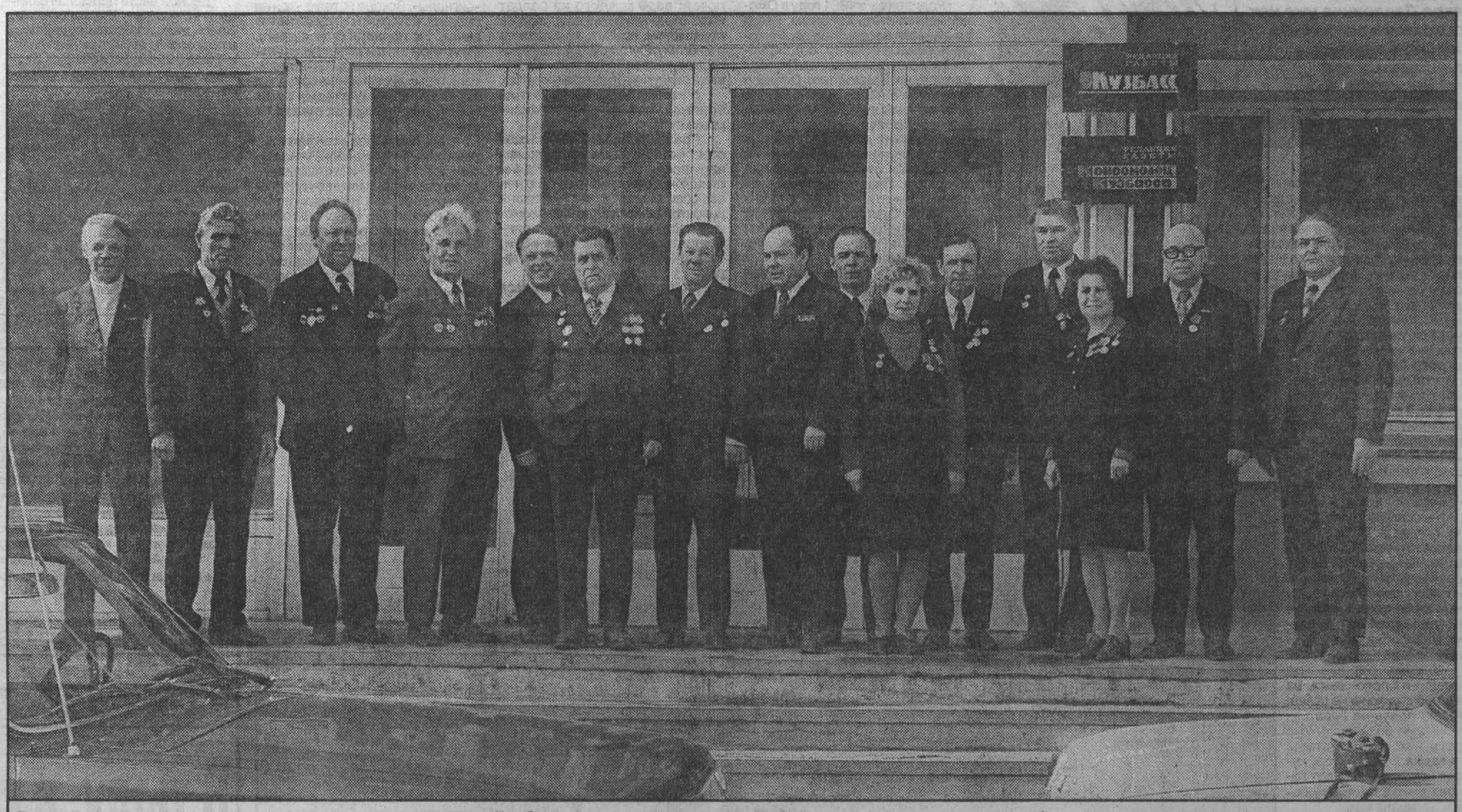
Встреча фронтовиков издательства и редакции газеты «Кузбасс» в год тридцатилетия Победы.