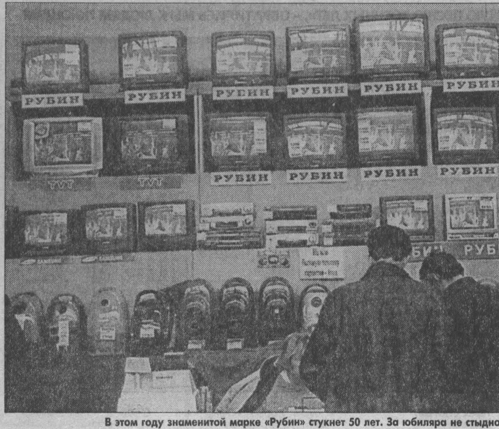
В этом году знаменитой марке «Рубин» стукнет 50 лет. За юбиляра не стыдно.