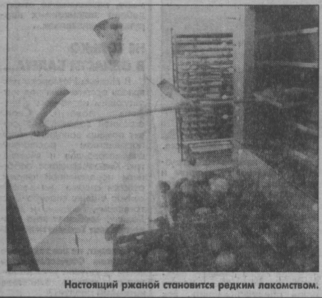
Настоящий ржаной становится редким лакомством.