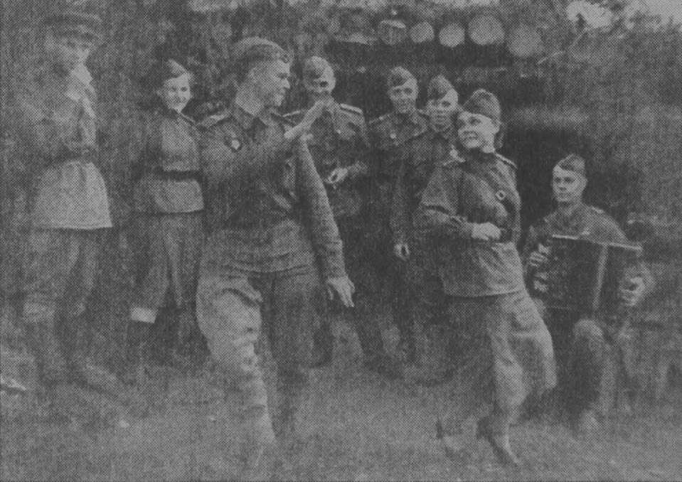
1943 год. Смоленщина.

Никита БОГОСЛОВСКИЙ, композитор: - «Темная ночь». Почему? Да потому что я ее написал! А вообще в военное время творилось почему-то гораздо больше хороших песен, чем в «штатское». Наверное, перед лицом большой беды людям свойственно внутренне собираться, подтягиваться. И говорить, и думать о чем-то главном, что в тебе зложено. Потому появлялось на свет столько доброго, светлого... Если говорить о «чужих» песнях, то для меня все композиции о войне, написанные Соловьевым-Седым - образцы настоящего таланта и творчества. И, конечно, очень люблю «Эх, дороги...» Новикова.