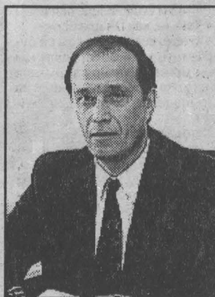
С уважением А.А.ВЕШНЯКОВ.

Статьей 3 этого же проекта Федерального закона предусмотрено, что пункт 1 статьи 1 предлагаемого закона не применяется при проведении выборов, назна-