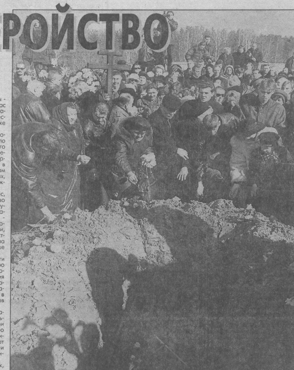
Юлию похоронили, а оставшимся членам экипажа предложили путевки в Стамбул