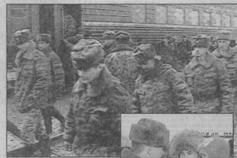
НА СНИМКАХ: отправление военных с железнодорожной станции Ханкала; здоровый, малыш; под мирным небом.

Этого момента в Кубассе ждали полтора года — ровно столько пробыли на Северном Кавказе юргинские мотострелки. Начали в сентябре 99-го с Дагестана, куда вторглись возглавляемые Хаттабом и Басаевым боевики, потом — Чечня. Позади остались сотни километров дорог войны, горных троп Терского хребта, Аргунского и Веденского ущелий, десятки удачных операций. В боях бригада потеряла около 100 человек убитыми и порядка 200 ранеными. За мужество и героизм более двух с половиной тысяч человек представляли к государственным наградам. К четырем Героям России, получившим это звание за прошлую чеченскую войну посмертно, прибавился еще один — младший сержант Кузнецов из Омска. Сейчас он демобилизовался и вернулся домой.