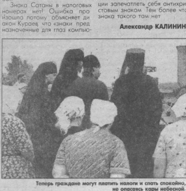
Теперь граждане могут платить налоги и спать спокойно, не опасаясь кары небесной.