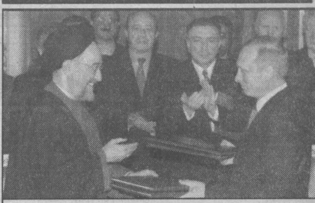
об этом говорят