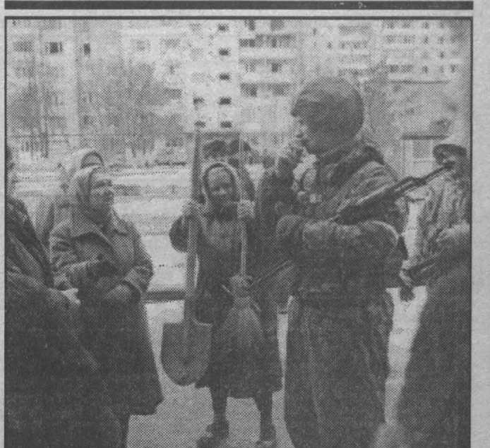
об этом говорят