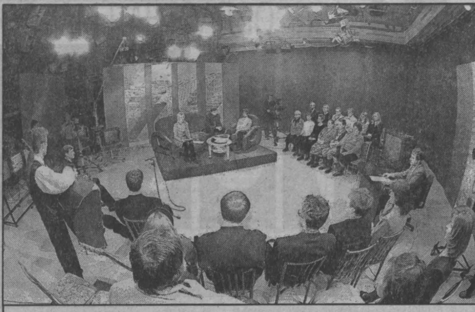
вместе у телевизора