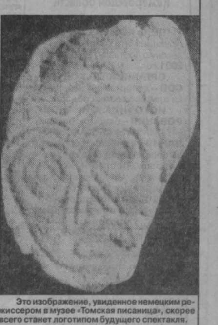
Это изображение, увидевшее немецким режиссером в музее «Томская писанина», скорее всего станет логотипом будущего спектакля.

— Я знаю, что вы в Сибири впервые. Какое впечатление произвел на вас Кузбасс, не жалевте ли о том, что приехали именно сюда? — Жалею? О, нет, нет! Мои друзья назвали эту мою поездку «экспедицией в Сибирь», с трепетом предупреждали о том, что как пишут в наших газетах, здесь у вас «очень холодно и... страшно». Все оказалось наоборот. Это холодно — это правда. Но на самом деле здесь — прекрасно! Удивительно красивая природа! И самое главное — люди. Люди чистые, сердечные, на редкость дружелюбные. Все эти дни я чувствовал себя прекрасно, и впечатления мои самые-самые хорошие. — Как возникла идея сотрудничества с кузбасским театром? Почему «Покет опера», которую вы возглавляете, выбрала для столь необычной творческой работы именно Кемерово? И, наконец, чем обусловлен выбор для постановки «Пиковой дамы»? — В Германии да и, наверное, во всей Европе сегодня велик интерес к русскому искусству, к Сибири. А идея этого проекта родилась в Англии, где живет господин Дэвид Земан — дирижер и aranжировщик нашего театра. Ведь «Покет опера» — это интернациональное дело. Играл свои спектакли во многих странах, а дом наш — в Нюрнберге. (Окончание на 4-й стр.)