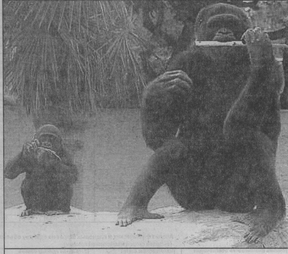
братья наши меньшие

Вчера в командировку в Чечню отправился очередной сводный отряд милиционеров. Он укомплектован сотрудниками ОМОН и ППС из городов области. Они сменяют на боевом посту кузбасских милиционеров, которые сейчас несут службу в Чеченской республике. Бойцы прошли подготовку и полностью экипированы снаряжением, боеприпасами и всем необходимым для жизнедеятельности. Командировка продлится 90 суток.