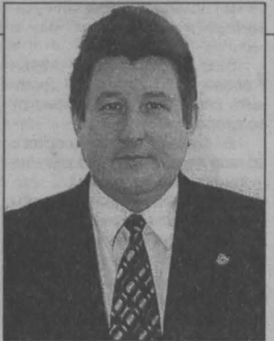
Расспрашивала Татьяна КРАСНОСЕЛЬСКАЯ.