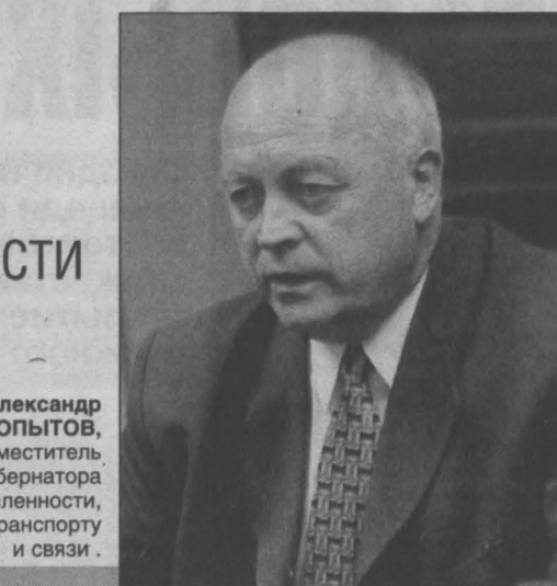
Александр КОБЫТОВ, заместитель губернатора Кемеровской области по промышленности, транспорту и связи.

В 2001 году объем инвестиций, направленных на техническое перевооружение, модернизацию и расширение предприятий промышленности, транспорта и связи, возрос на 19 проц. и составил около 20 млрд. рублей.