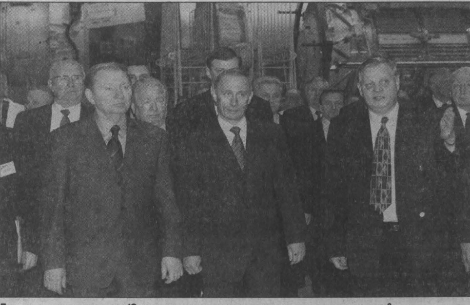
Получается, президентом на «Южмаше» украинское правительство попросту витрало очки?