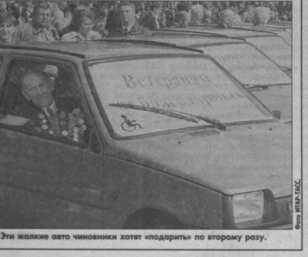
Эти жалкие авто чиновники хотят «подарить» по второму разу.