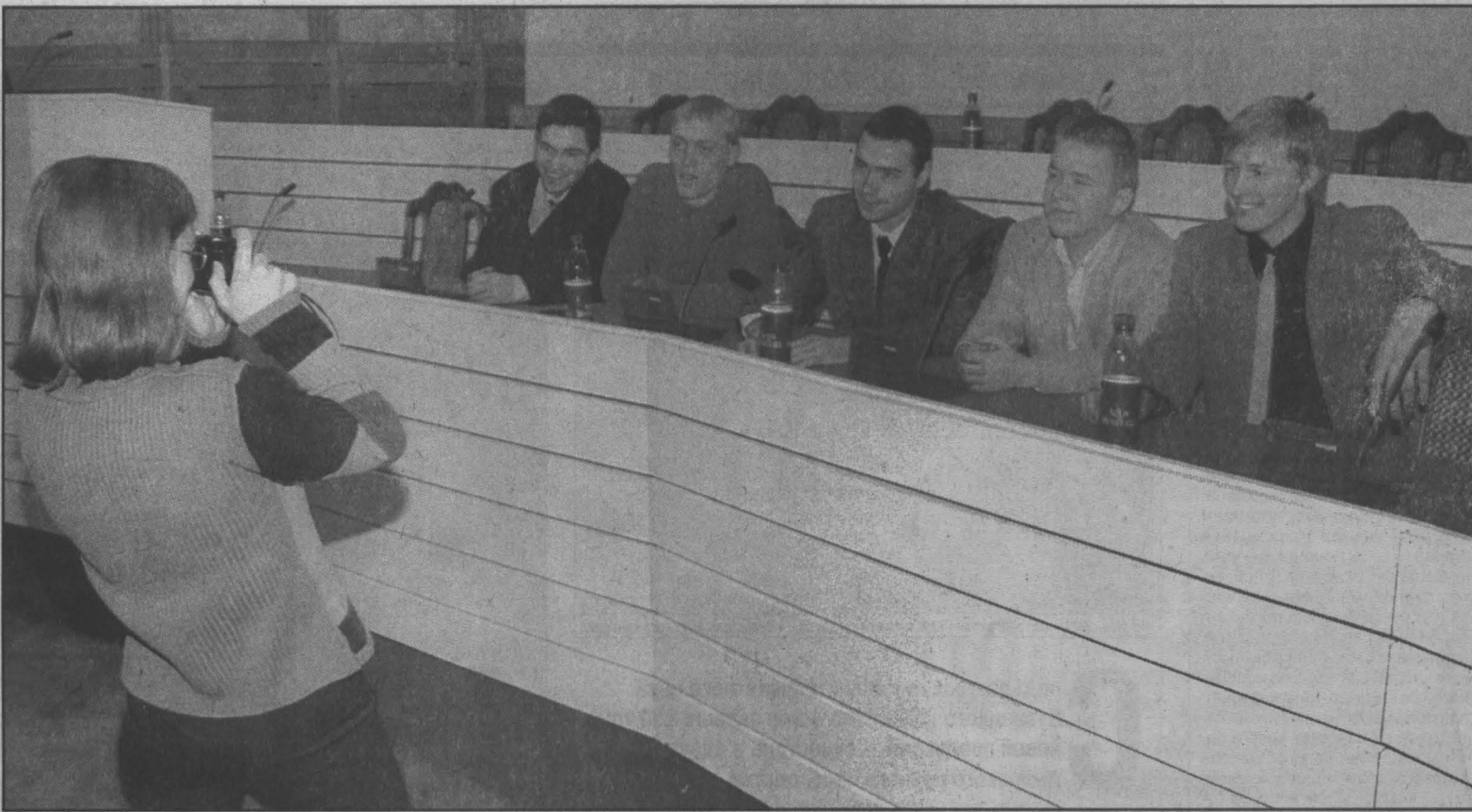
Гости администрации в овальном зале на месте президиума. Снимок на память.

Вчера в администрации области прошел день открытых дверей для студентов кузбасских вузов.