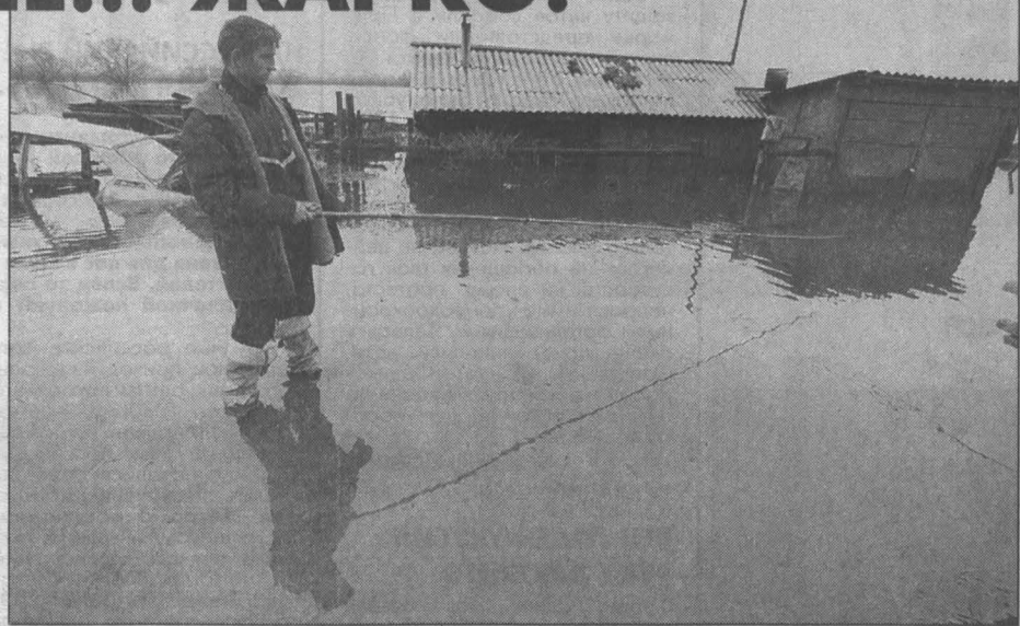
Осадков будет меньше, а поповов - больше.