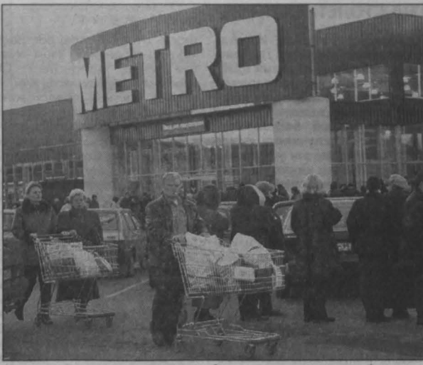
Новые гигантские супермаркеты обещают нам дешевле изобилие.

В магазинах Ramstor, например, акkurat к открытию Metro «железу» продавали аж по 55 рублей, чуть ли не вдвое дешевле обычного. И еще много чего вдруг стало дешевле. Известная сеть магазинов по продаже бытовой техники объявила, что подумывает о том, чтобы выставить 100 наименований товаров с 50-процентной (!) скидкой. Кто больше?