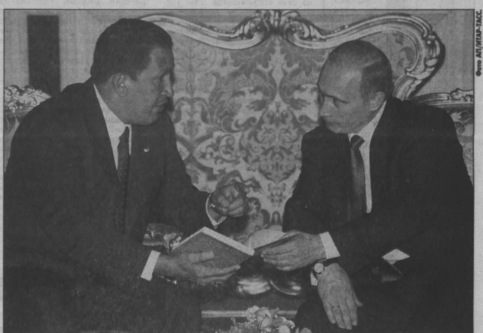
Владимир Путин и президент Венесуэлы, председатель ОПЕК Уго Чавес обменялись аргументами.

Хотя сейчас цены на нефть еще далеки от минимальных значений трех-четырёхлетней