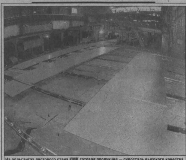
На рольгангах листового стана КМК готовая продукция — судосталь высокого качества.