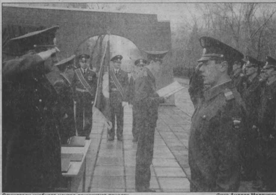
Слушатели учебного центра принимают присягу.