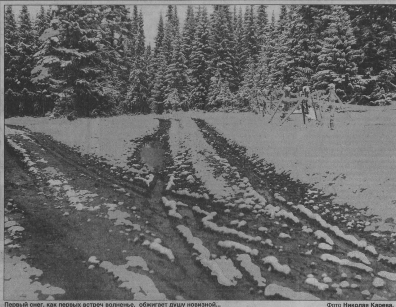
Первый снег, как первых встреч волнение, обжигает душу новизной...