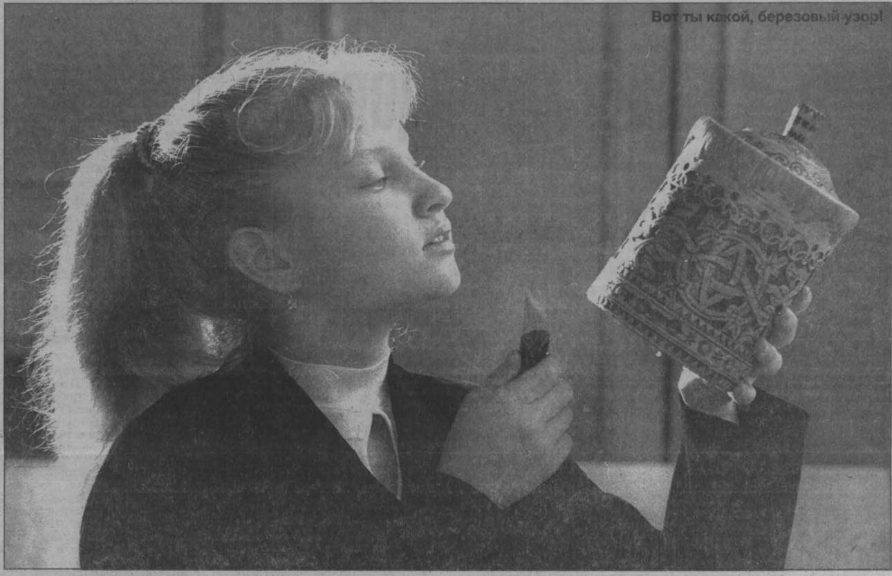
Вот ты какой, березовый узор!