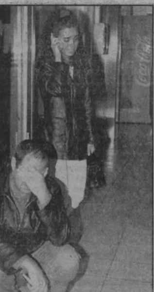
Близкие погибших пассажиров в новосибирском аэропорту.