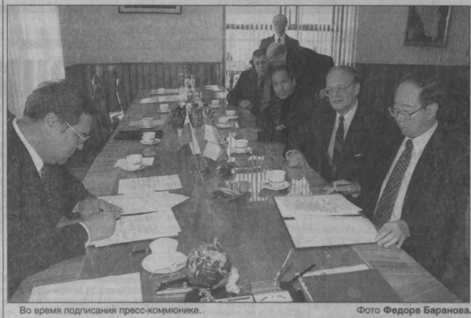
Во время подписания пресс-коммюнике.

По окончании беседы А. Г. Тулеев и г-н Хонг подписали пресс-коммюнике.