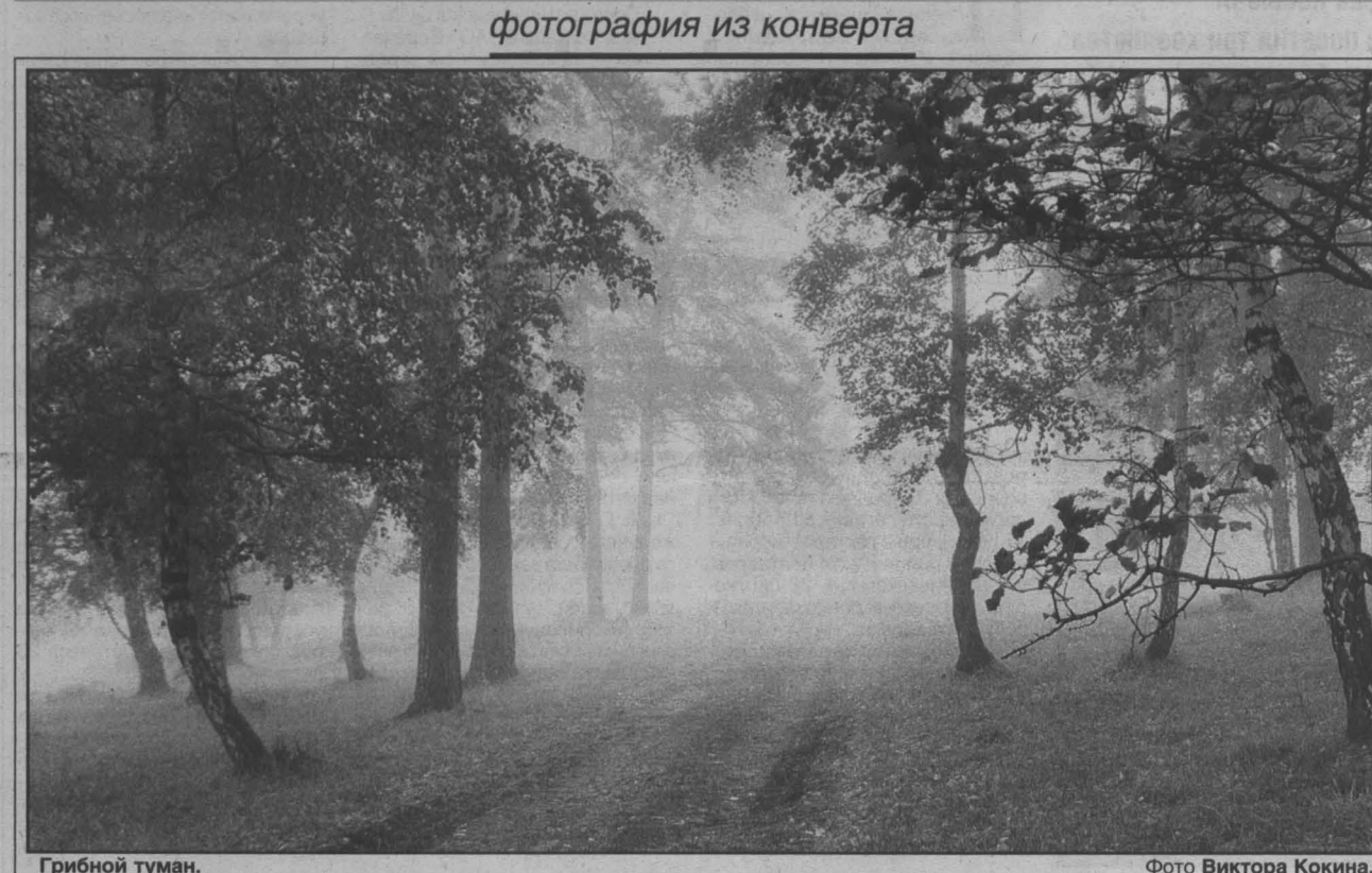
фотография из конверта

стройотряд и в плане общения, для многих это первый трудовой коллектив, и в нем сразу видно, кто чего стоит. Уже сентябрь, и ребята ждут совсем другие заботы. Они расстались до следующего трудового семестра, который обещает быть более интересным, ведь на строительстве и благоустройстве города будут трудиться не менее 200 студентов из всех учебных заведений города. Сергей ЩЕРБИНИН. Анжеро-Судженск.