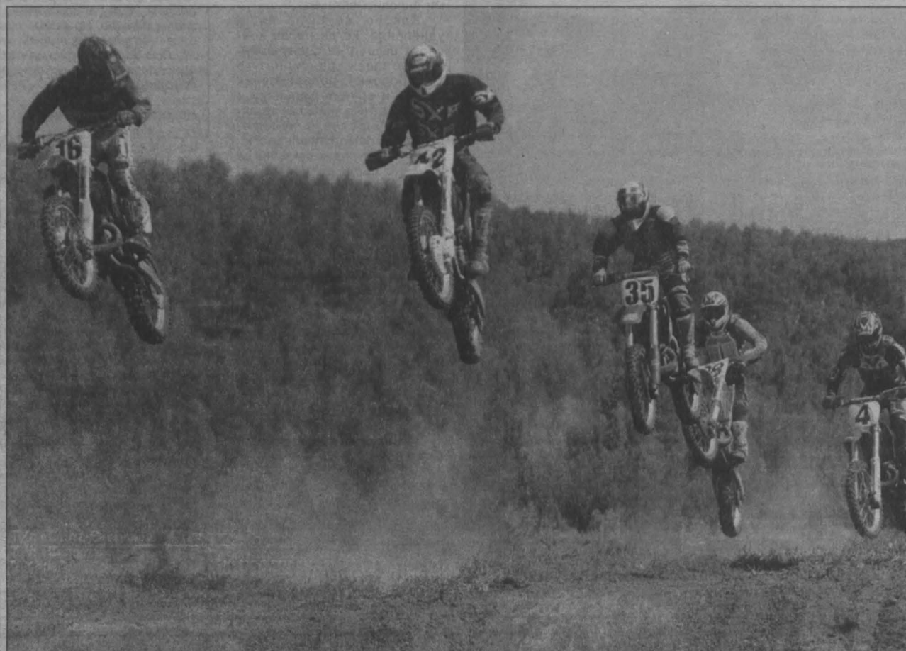
Полет к победе.