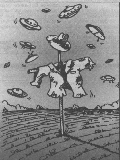
Иллюстрация работы Алексея Плотникова

Как видим, история повторилась. Причем начало ее не в 1947-м, а в 1914 году. Если американские секретные документы — это перлы в уфологии, то свидетельства из российских архивов — подлинные бриллианты для исследователя НЛО.