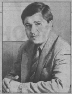
Коллектив редакции газеты «Кузбасс».