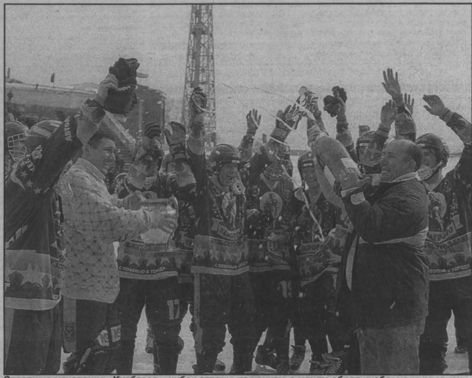
Звездные мгновения «Кузбасса»: кубок страны по хоккею с мячом обрел кузбасскую прописку.