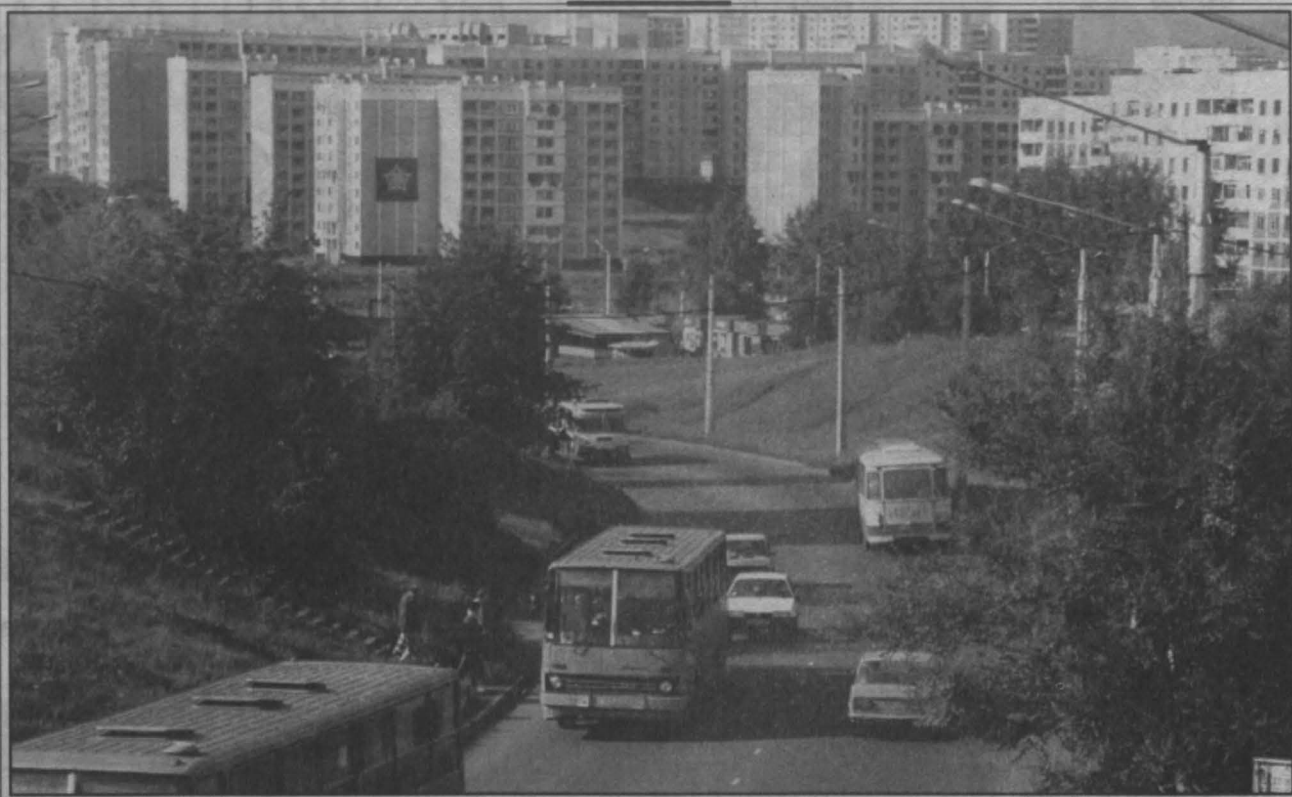
Новоильинский район Новокузнецка.